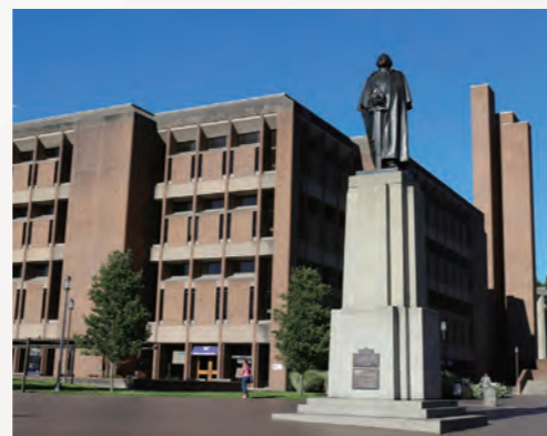
※実際のプログラムはダウンタウンキャンパスで行います。